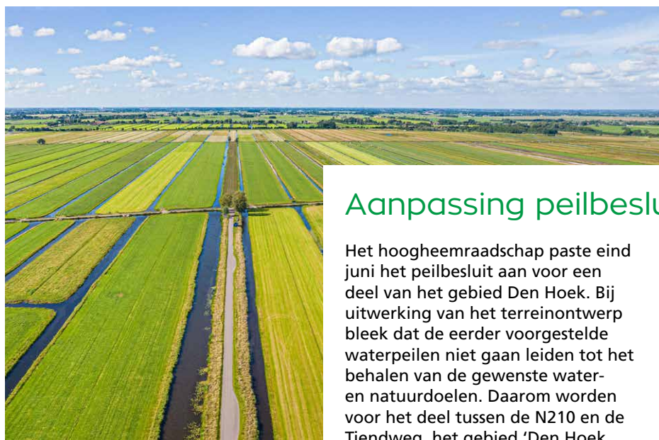
Den Hoek vanuit de lucht (Stephan Tellier)