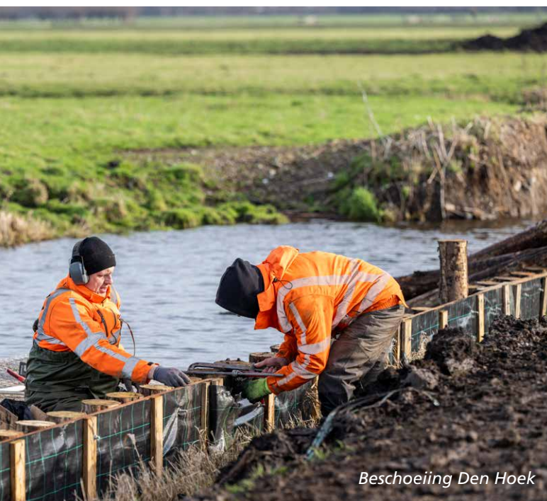
Beschoeiing Den Hoek